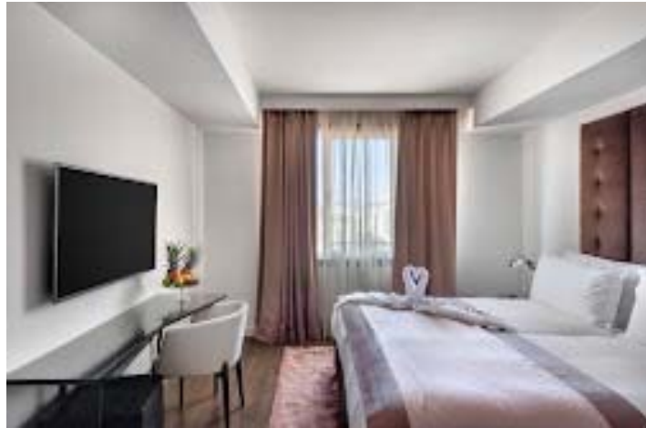
Hotel LADY STERN Jerusalem