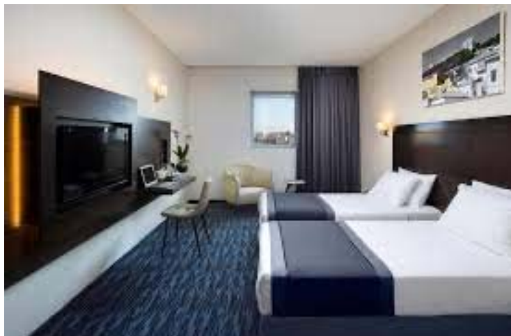
Hotel GOLDEN CROWN Nazareth