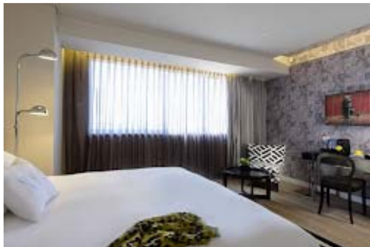
Hotel NYX Tel Aviv